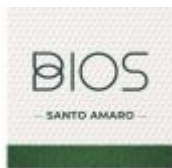
Tabela de venda - BIOS SANTO AMARO

Impresso por Gabriel Pomar de Almeida E Silva em 02/04/2024 14:20